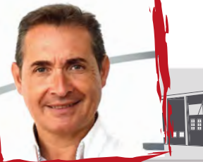
Saluda | Michel Montaner, alcalde de Xirivella