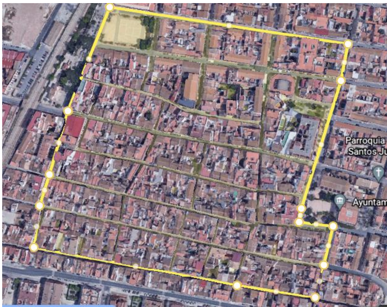
2º Vuelta San Silvestre 1