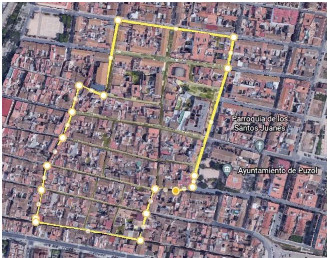
1º Vuelta San Silvestre 1

El recorrido de la carrera se compone de dos vueltas. Una primera vuelta inicial de 1km y una segunda vuelta de 2km.